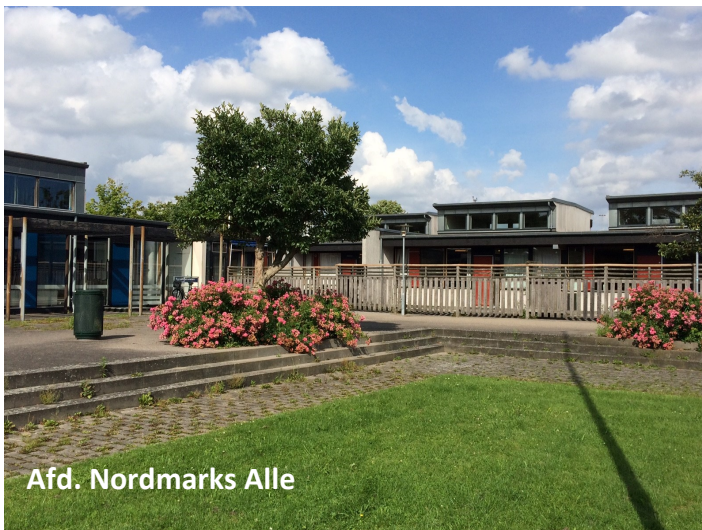
Afd. Nordmarks Alle